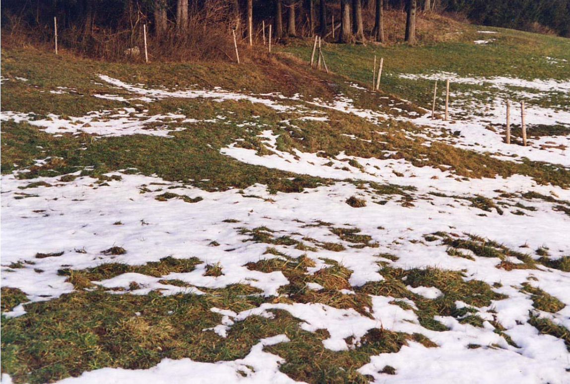
Kalkgräberspuren in einer Viehweide oberhalb Ussenried.

Von Probstried auf der Straße nach Schratzenbach kommend gehen wir kurz vor den Wohlmutser Häusern beim 50 km-Schild zum Wald. Dort marschieren wir am besten zur Südseite der Baumgruppe auf der Wiese und treten erst dort in das hier weniger starke Dickicht ein. Nach wenigen Metern trifft man bereits auf die weit verbreiteten Erdlöcher, sie sind umgeben von Gestein, das sich nicht zum Brennen eignete.