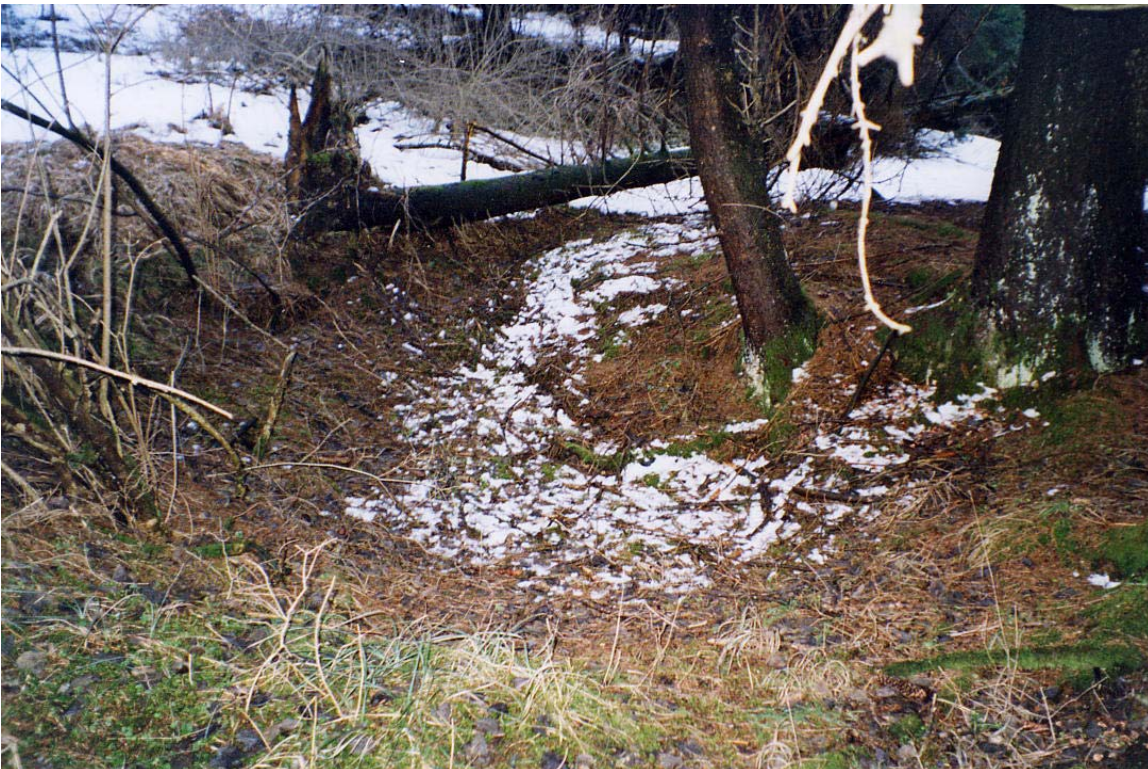
Mulde im Wald bei Buchen deutet ebenfalls auf eine Kalkgrube hin.