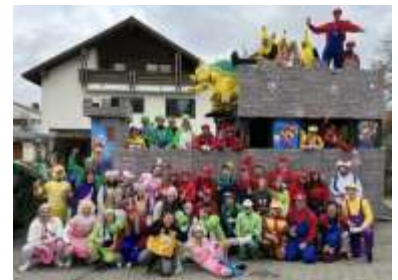
„Super Mario“ war das Faschingsthema

Mit Faschingswagen starteten wir ins Jahr und veranstalteten den Bürgerball. Danach kam der Funken. Es fand ein Skiausflug mit der KLJB Schrattenbach statt. Der Maibaum wurde mit der Musikkapelle und der Feuerwehr aufgestellt. Ein Highlight war das Fußball Ortsteilturnier. Im September war unsere Hauptversammlung und im Oktober das beliebte Weinfest. Im Dezember folgte der Seniorenachmittag, Nikolaus-Hausbesuche, ein Ausflug auf das „Tollwood“ München und eine Weihnachtsfeier. Das Jahr klang aus mit einem Christkindlschnaps.