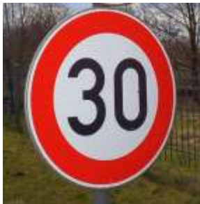
In einer Umfrage zur 30-km/h-Testphase im Ortskern können die Bürger*innen ihre Meinung mitteilen