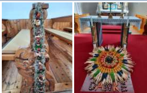
Der Kirchenschmuck zu „Erntedank“