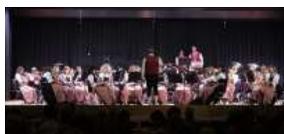
Beim Osterkonzert auf der Bühne