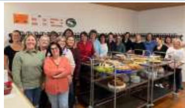
Die Helferinnen beim Kuchenverkauf

Trotz des schlechten Wetters fanden zahlreiche Besucher den Weg in die Festhalle zum Kinderflohmarkt, in welcher die Kinder ihre Spielsachen zum Verkauf anboten. Auch bei Kaffee und Kuchen konnte man es sich gutgehen lassen. Traditionell nahmen die Freien Wähler Frauen wieder am Weihnachtsmarkt teil und verwöhnten die Besucherinnen und Besucher mit leckeren selbst hergestellten Likören. Mit dem Erlös aus den Veranstaltungen konnten das Kinderheim in Probstried, der Elternbeirat der Grund- und Mittelschule Dietmannsried, die Musikkapelle Dietmannsried und die Nikolaus-Päckchen-Aktion unterstützt werden.