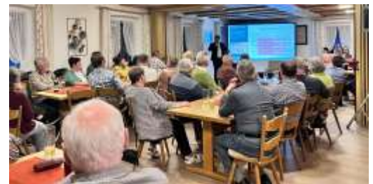
Gute Resonanz bei den Bürgerversammlungen 2023