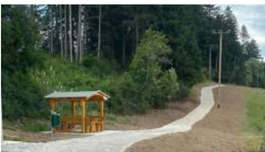
Der neue Wanderweg auf der Wilhelmshöhe bei Probstried