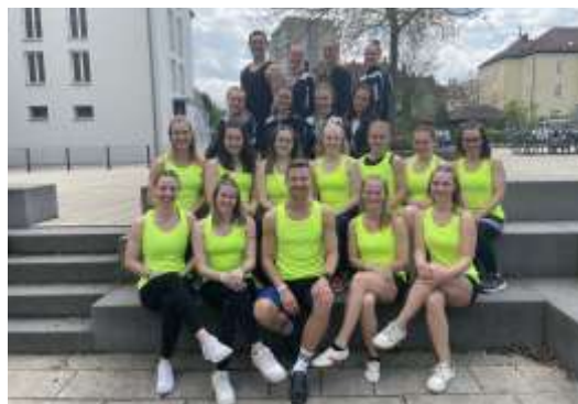
Die Wettkämpfer in bester Laune

Auch im Jahr 2023 war wieder viel los in der Turnabteilung. Im März wurde der neue Kursraum feierlich durch den Bürgermeister eröffnet. Anschließend gab es „Schnupperstunden“ in unsere neuen Kurse. Durch den Raum können wir nun ein vielseitiges und tolles Kursprogramm anbieten. Auch unsere Wettkämpfer waren auf mehreren Meisterschaften mit am Start, unter anderem auf dem Turnfest in Regensburg sowie auf der Deutschen Meisterschaft in Berlin. Ein Dankeschön geht an alle Trainer und Mitglieder für die tolle Zusammenarbeit. Wir freuen uns schon auf das nächste Jahr mit euch.