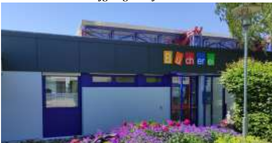
Die Fassade der Bücherei wurde neu gestaltet