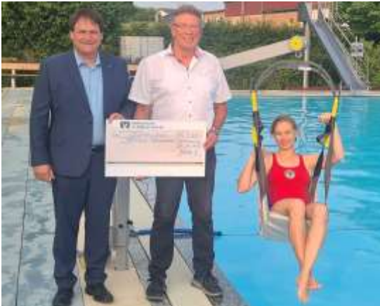
Spendenübergabe für den Behindertenlift im Freibad durch die Bürgerstiftung Dietmannsried