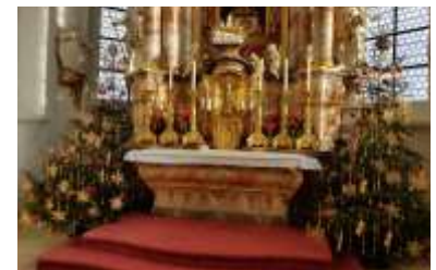
Besonders zur Weihnachtszeit lohnt sich der Besuch der Reicholzrieder Kirche