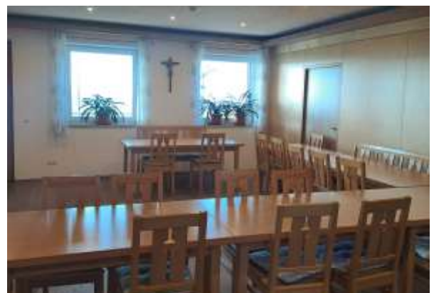
Das Schützenheim Probstried steht künftig für standesamtliche Trauungen zur Verfügung