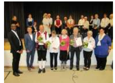
Ehrungen am Pfarrfamiliennachmittag