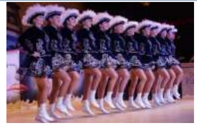
Die Prinzengarde in Aktion