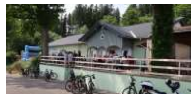
Eröffnung des neuen Schützenheimes