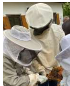
Bild rechts: Praxiskurs Königinnenzucht