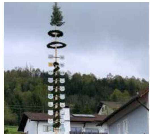
Auf gutem Fundament gebaut – die neue Halterung des Maibaumes in Schrattenbach