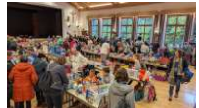
Der Kinderflohmarkt in der Festhalle