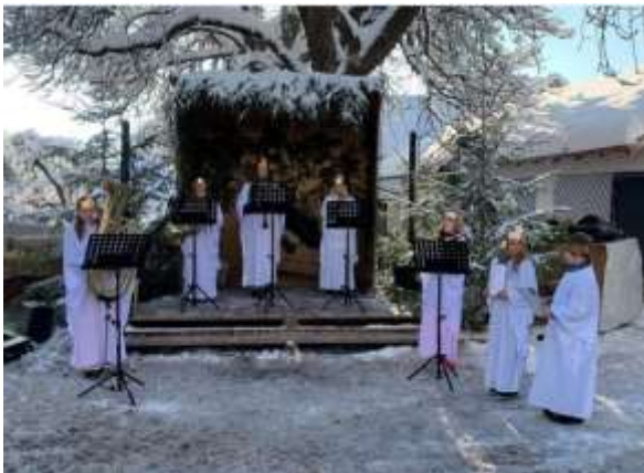
Engelschor beim Weihnachtsmarkt Schrattenbach