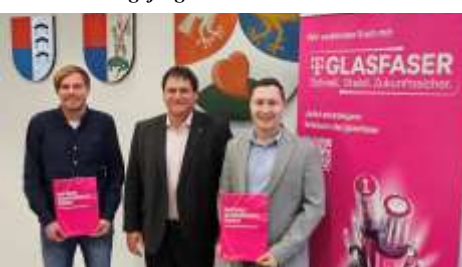
Vertragsunterzeichnung zum Glasfaserausbau in Dietmannsried, Überbach und Reichholzried