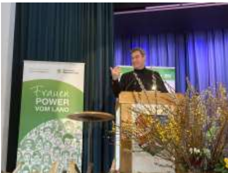
Dr. Markus Söder beim Landfrauentag in der Dietmannsrieder Festhalle