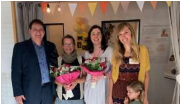
Das „Wunderwerk“ eröffnet ggü. des Rathauses seine Pforten