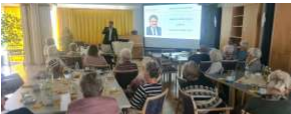
Rathausstunde im AllgäuStift-Seniorenzentrum