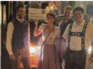
Der Festwochenbus beförderte viele Dietmannsrieder