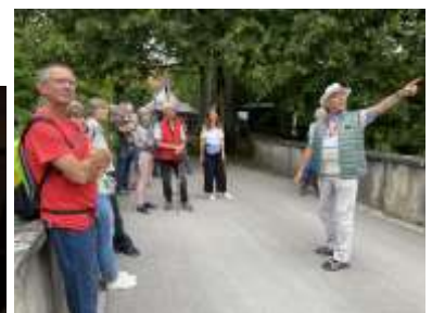
Stadtführung in Bad Waldsee