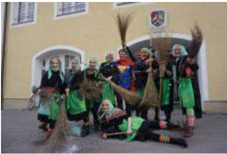
Der Rathaussturm 2023