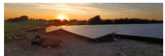
In Todtenberg wird mit dieser PV-Anlage Strom erzeugt