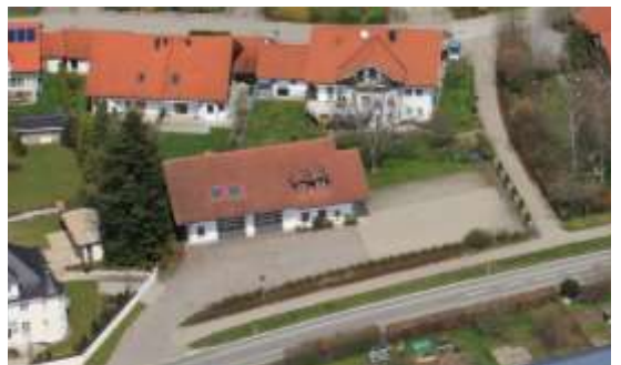
Der Bau- und Umweltausschuss hat die Erweiterungsplanung für das Feuerwehrhaus Probstried genehmigt