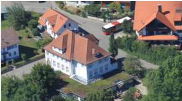
Der Marktgemeinderat beauftragte weitere Planungsleistungen für die Sanierung und Erweiterung des Kindergartens Probstried