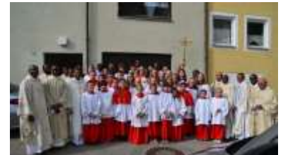
Zum 25jährigen Priesterjubiläum kamen zahlreiche Priester und Ministranten

Der Vereingottesdienst am 24. September in Schrattenbach war ein großer Erfolg. Die Messe verzeichnete eine hohe Besucherzahl und sämtliche Fahnenabordnungen der örtlichen Vereine waren zahlreich vertreten. Nach dem Gottesdienst versammelte sich die Gemeinschaft zum Frühschoppen auf dem Kirchplatz. Die Musikkapelle Schrattenbach sorgte für stimmungsvolle Klänge, während die Besucher in geselliger Runde das sonnige Wetter und die enge Verbundenheit genossen.