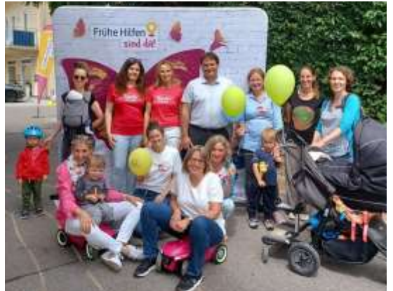
Das Team der „Frühe Hilfen“ kam nach Dietmannsried