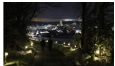
Der „Lichterweg“ mit Panoramablick

Die Freiwillige Feuerwehr Probstried sammelte im Jahr 2023 Spenden für die „Sternstunden“. Knapp 250 Laternen säumten den Weg vom Ortsausgang Probstried über das Schützenheim bis zum neu angelegten Panoramaweg „Am weißen Bühl“. Damit lud die Freiwillige Feuerwehr die Bevölkerung im Dezember zu besinnlichen Spaziergängen in malerischer Atmosphäre ein. Ziel des „Probstrieder Lichterweges“ war es, Spenden für die „Sternstunden“ zu sammeln und damit Kindern in Not zu helfen. Der Weg erstrahlte mit Hilfe beleuchteter Gläser, welche von der Bevölkerung gegen eine Spende erworben und dekoriert wurden. Auch die Einnahmen der letzten Altpapiersammlung der FFW Probstried gingen an die Sternstunden.