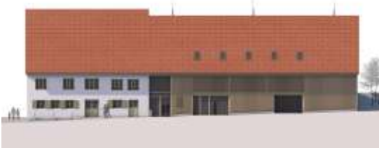
Die neue Ostansicht des Gasthof „Hirsch“ mit Gästezimmer und Tiefgarageneinfahrt