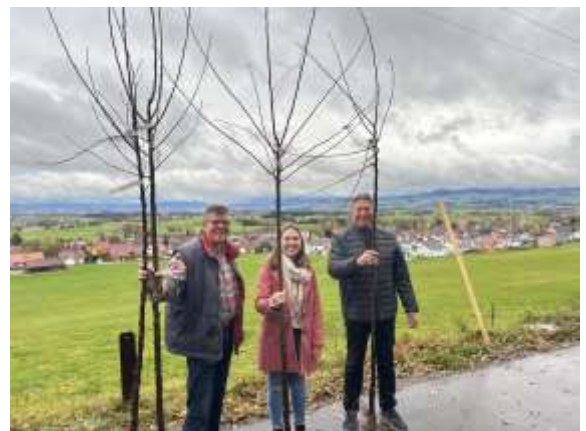
Das Projekt „Streuobstwiesen für alle“ – Vereine, Bürgerinnen und Bürger beteiligten sich daran