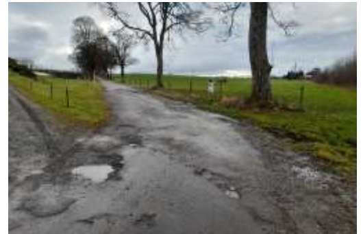
Die Straße zum Schützenheim Dietmannsried wurde in das Straßensanierungsprogramm aufgenommen