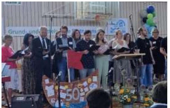
Auch der Lehrerchor gab einen Beitrag zum Jubiläum der Grund- und Mittelschule Dietmannsried