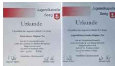
Leistung beim Vorspielwettbewerb

Das Vorchester und das Jugendblasorchester Allgäuer Tor sind im Mai mit dem Bus zu einem Musikfest für Jugendorchester mit Vorspielwettbewerb nach Seeg gefahren. Unsere beiden Orchester zeigten sich musikalisch von ihrer besten Seite! Die Jury war sichtlich angetan von der hohen Leistung. Im Festzelt konnten wir uns dann noch mit Essen und Getränken stärken sowie verschiedene Spielstationen bei Live-Blasmusik, gespielt von Jugendkapellen, erleben.