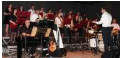
Die Musikkapelle bei ihren Konzerten