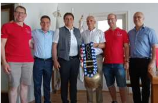
Die Bürgermeister, Vorstände und Dirigenten der beiden Gemeinden Dietmannsried und Tat