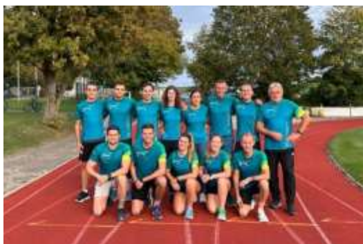
Das Team in der Abteilung Leichtathletik

Ein besonderes Highlight war unsere Laufreise nach Lissabon, die nicht nur sportliche Herausforderungen, sondern auch kulturellen Austausch bot. Die Einweihung der neuen Tartanbahn in Kempten markierte einen Meilenstein für zukünftige Erfolge.