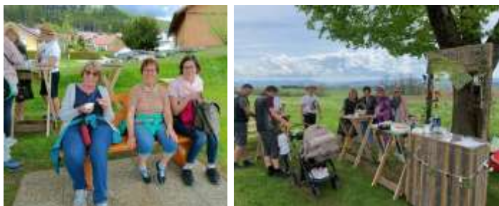
Die Bank des Gartenbauvereins wird gut genutzt und bei der Ortsrallye gebührend gefeiert

Wir blicken auf ein tolles Gartenjahr mit vielen schönen Erlebnissen zurück. Im Mai fanden unsere Pflanzentauschaktion und zum ersten Mal die Vereinsbänke-Rallye statt. Jeder Schrattenbacher Verein stellte eine Bank rund um bzw. im Ort auf und lud mit Getränken und Snacks die zahlreichen Besucher zum Verweilen ein. Im Juli fand unser Grillfest statt und ein paar Wochen später der Tagesausflug zu den Weihenstephaner Gärten. Für das Jahr 2024 sind neben der Generalversammlung im März, im Mai die Pflanzentauschaktion und im Juli ein Grillfest geplant.