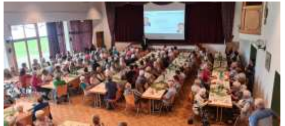
Der Senioren-Mittagstisch wird sehr gut angenommen