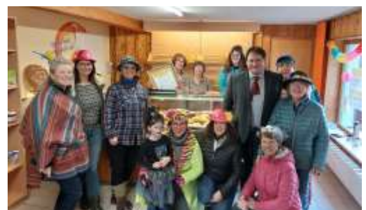
Große Freude herrschte bei der Eröffnung des „Brotlädele“ Reicholzried