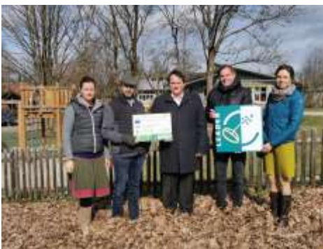
Der Förderbescheid für den Calisthenics-Park wurde vor Ort übergeben