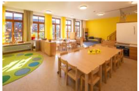
Trotz der Anpassung der Gebühren für die Betreuungseinrichtungen sind diese im Vergleich weiterhin niedrig