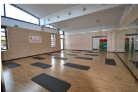
Der neue Sport- und Bewegungsraum ist bei vielen Nutzern sehr gefragt