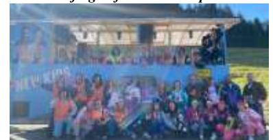
Der Faschingswagen der KLJB