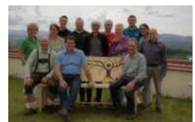
Beim „Probhocken“ in Schrattenbach

Probhocken auf'm Schrattenbacher Vereinsbänkle: Bei schönstem Frühlingswetter kamen viele Besucher um einen Spaziergang zu machen und die renovierten, neu gebauten oder individuell gestalteten Bänke zu bestaunen und sich einmal draufzuhocken. Die Vereine und Organisationen, die sich um je eine Bank im Ort gekümmert haben, verpflegten Ihre Gäste und konnten in Gesprächen Werbung für sich machen. Die Gäste hatten viel Spaß und einen wunderbaren Ausblick in die Allgäuer Berge. So mancher „Probhocker“ wollte gar nicht mehr aufstehen.