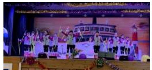
Tolles Programm beim Seniorenmittagstisch – hier sorgen die FGD-Kids für gute Stimmung