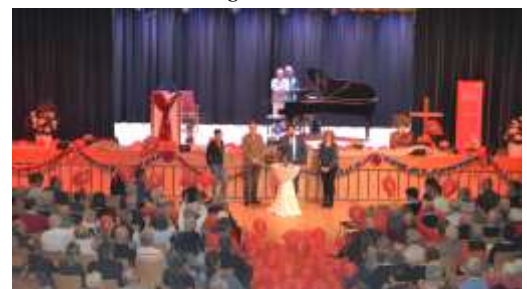
Zur Marriage-Week empfangen die Standesbeamten und der Bürgermeister alle Paare mit einem Luftballonregen