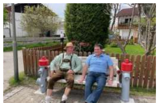
Vereinsbänkle in Schrattenbach – hier auf der kreativen Bank der Feuerwehr