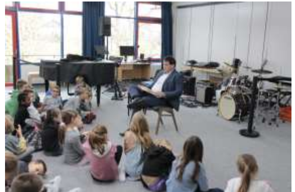
Der Erste Bürgermeister beim Vorlesestag in der Schule