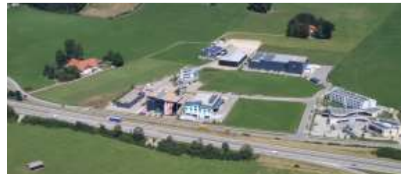
Der Bebauungsplan Gewerbepark Ost IV wurde als Satzung beschlossen