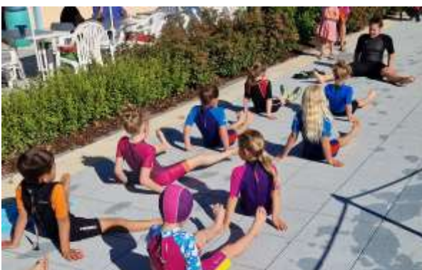
Trockenübung beim Schwimmkurs im Freibad Dietmannsried