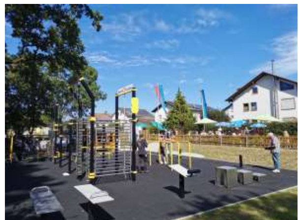
Viele Bürgerinnen und Bürger kamen zur Eröffnung und Erläuterung der Geräte im neuen Calisthenics-Workout-Park