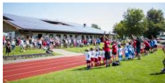
Stimmung auf dem Fußballplatz

Nachdem die Fußballer im Sommer zwei Abstiege mit der 1. Herrenmannschaft und der Damenmannschaft verkraften mussten, machte sich im Anschluss Aufbruchstimmung breit. Fast alle Mannschaften bis in den Jugendbereich durften sich über viele Neuzugänge freuen. Dadurch konnte auch wieder eine Eigenständigkeit ohne Spielgemeinschaft im Jugendbereich realisiert werden. Wir bedanken uns bei allen Trainern, Betreuern und Verantwortlichen für die getane Arbeit und freuen uns auf eine erfolgreiche Zukunft.