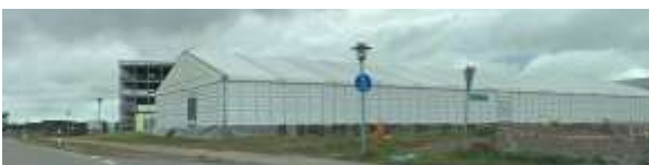
An der Glaserstraße werden weitere Flüchtlinge untergebracht