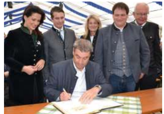
Dr. Markus Söder beim Eintrag in das Goldene Buch der Gemeinde

Pünktlich zum Start in den Mai werden wieder unsere schönen Maibäume aufgestellt und die entsprechenden Maibaumfeste abgehalten. „Alles neu macht der Mai“ heißt es für das Maibaumfundament in Schrattenbach, welches in den Wochen davor erneuert wurde. Der Marktgemeinderat geht auf Rundfahrt und besichtigt diverse Projekte in den Ortsteilen. Ganz neue Wege gehen die Vereine von Schrattenbach, um die Kommunikation und die Erholung zu fördern: Jeder Verein stellt im Ort ein sogenanntes „Vereinsbänkle“ auf; gleich am Eröffnungstag sind zahlreiche Bürgerinnen und Bürger bei diesen zu finden. Um die Energiethemen in unserer Gemeinde weiter voranzubringen, wird innerhalb der Verwaltung die Beauftragung einer kommunalen Wärmeplanung für alle Ortsteile vorbereitet.