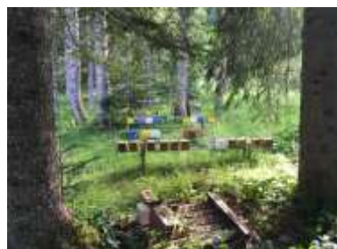
Besuch der Belegstelle im Ostertal

Nach der Jahreshauptversammlung starteten wir ins Jahr mit dem Kurs "Königinnenzucht für Einsteiger" in Theorie und Praxis. Weitere interessante Themen waren mit den Vorträgen "Trachtererkennung" und „Erste Hilfe rund um die Imkerei“ geboten. Unsere Mitglieder besuchten im Sommer das Bienenmuseum Illertissen, konnten sich beim Vereins-Sommerfest über ihr Bienenjahr austauschen und ihr Wissen Kindern beim Sommerferienprogramm weitergeben. Mit dem Vortrag „Aktuelles aus der Imkerei“ und unserem Stand am Weihnachtsmarkt beendeten wir unser erfolgreiches Honigjahr.