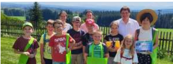
Action, Spiel und Spaß bietet das jährliche Ferienprogramm, hier mit Bürgermeister Werner Endres