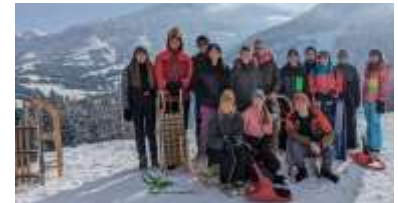
Rodelausflug auf die Buchelalpe