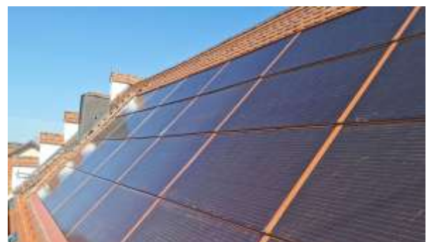
Im Sinne der Energiewende – der Markt Dietmannsried fördert PV-Dachanlagen