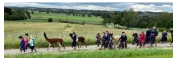
Die Wölflingsmädels bei einer Alpakawanderung

Die Jungs und Mädels der „Katholischen Pfadfinderschaft Europas“ treffen sich jeden Freitagnachmittag von 16 bis 18 Uhr zur Gruppenstunde im ehemaligen Pfarrhaus in Reicholzried. Das Jahr begann mit einer großartigen Leistung: Beim Singewettstreit in Neu-Ulm haben die Pfadfinderinnen den ersten Platz belegt und bei der Meutenrallye in Kösching nahmen die Jungs den ersten Preis mit nach Hause. Zu Beginn der Sommerferien ging es dann endlich wieder auf Fahrt; freie Natur, Spiel und Spaß, neue Freundschaften schließen, Kultur entdecken, Singen am Lagerfeuer, Schlafen im Zelt, Gottesdienste feiern, Freude am Leben... Die Pfadfinder waren in Niederösterreich, die Pfadfinderinnen in Südfrankreich und Lissabon, die Wölflingsjungs blieben im Allgäu und die Wölflingsmädels waren bei Augsburg. Wir freuen uns schon auf das neue Pfadfinderjahr und auf alle Abenteuer, die uns erwarten! Kinder und Jugendliche ab 7 Jahren sind jederzeit herzlich willkommen.