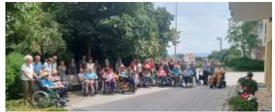
Das Netzwerk Familie und das Team des Kleegärtle laden jedes Jahr die Bewohnerinnen und Bewohner der Pflegestationen zu einem gemeinsamen Nachmittag ein