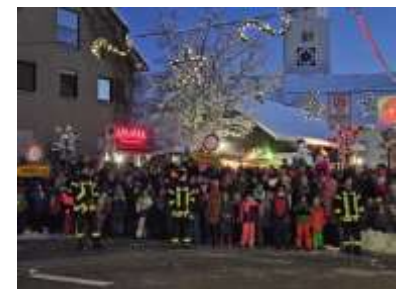
Erwartungsvolle Kinder vor dem Nikolauszug

Im Jahr 2023 war der Weihnachtsmarkt der Ortsvereine ein besonderes Highlight: Die Hauptstraße wurde gesperrt für eine rekordverdächtige Anzahl an Hütten: 59 Standbetreiber hatten sich angemeldet. Bei viel Schnee gab es viel zu bieten: Ein abwechslungsreiches Programm mit musikalischen Darbietungen, Gedichten und einer Zaubershow, Ausstellungen im Rathaus, ein Bastelangebot für Kinder, Sägevorführungen und eine Bandbreite an kreativen Accessoires sowie zahlreichen Verköstigungsangeboten. Der Nikolaus brachte unzähligen Kindern Geschenke. Die Ortsvereine bedanken sich ganz herzlich für die Unterstützung und die positive Annahme des Weihnachtsmarktes.