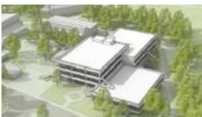
Verschiedene Erweiterungsmöglichkeiten werden für die Schulgebäude untersucht