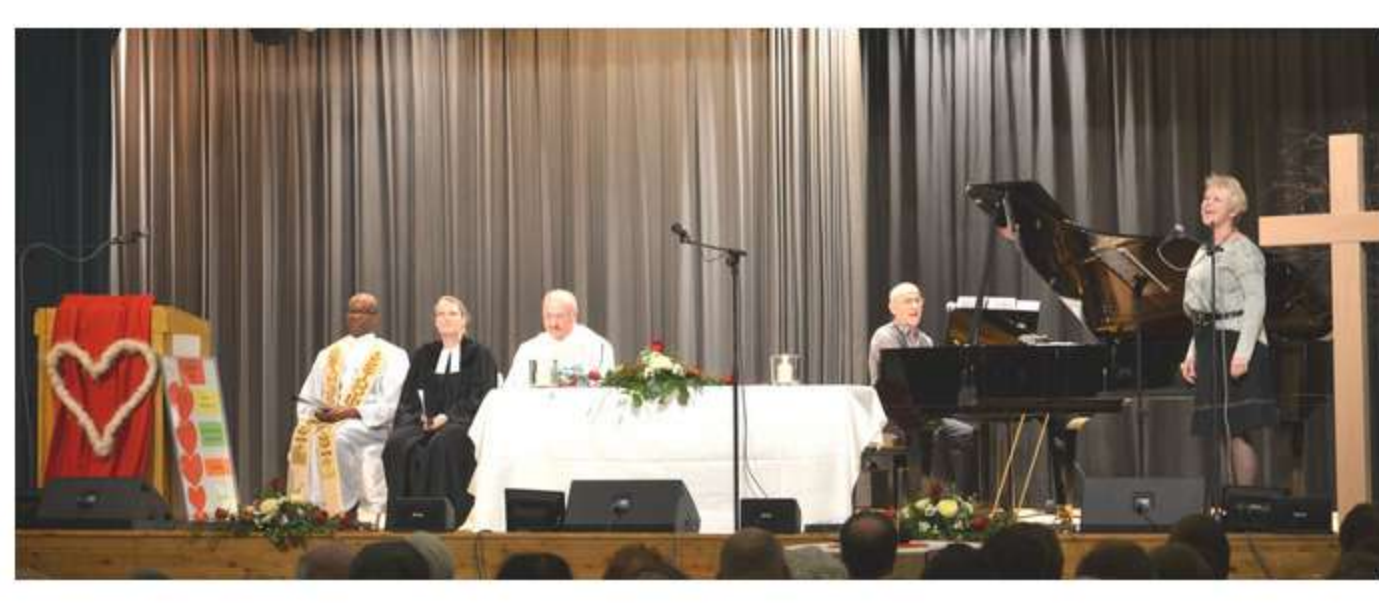
Feierlicher Gottesdienst am Valentinstag