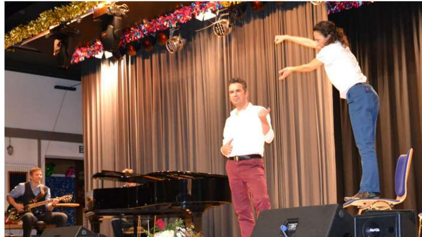
Das Improtheater „Zweifellos“ brachte mächtig Stimmung in den Saal