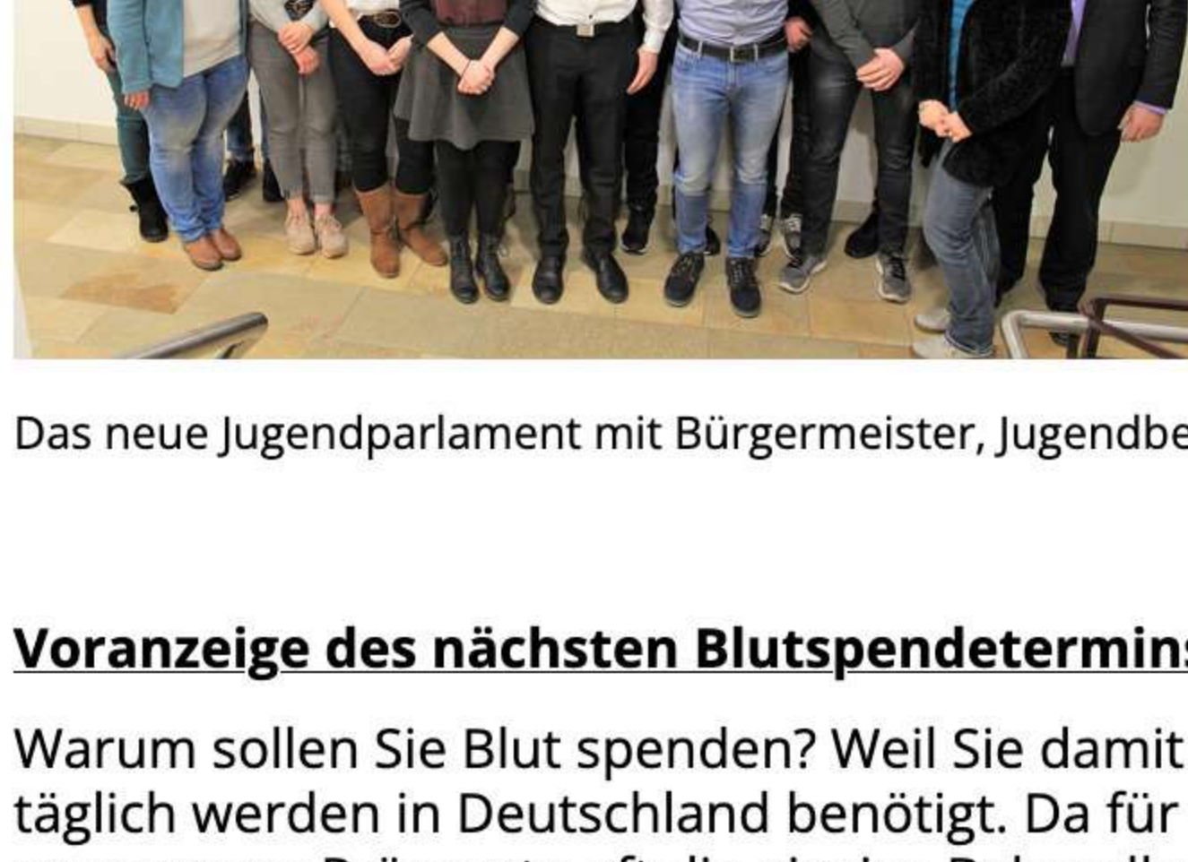
Das neue Jugendparlament mit Bürgermeister, Jugendbeauftragten und Jugendpflegerinnen