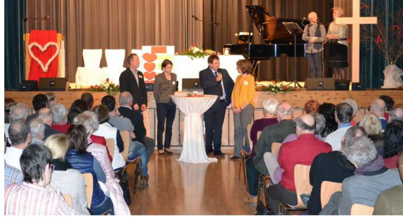
Begrüßung durch die Standesbeamten und den Bürgermeister