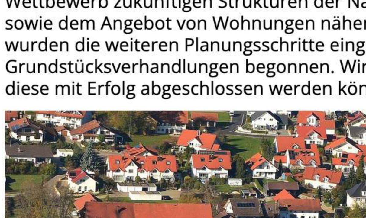
Überlegungen zur Nachfolgenutzung Gasthof Hirsch

Planerisch befasste sich der Gemeinderat und diverse andere Gremien mit wesentlichen Grundlagen hinsichtlich der Ortsentwicklung und der Entwicklung der Ortsteile. Wesentlichen Anteil am gemeinsamen Investitionshaushalt für den Brandschutz ist die Erweiterung des Feuerwehrhauses in Schratzenbach, in welchem die Arbeiten in den letzten Tagen begonnen wurden. Auch in der Endphase und kurz vor der Ausschreibung befindet sich die Neubeschaffung des Feuerwehrfahrzeuges für die Freiwillige Feuerwehr in Überbach.