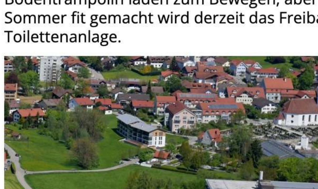
Arbeiten am Generationentreffpunkt starten

In den Osterferien soll mit dem Ausbau des Generationentreffpunktes in Dietmannsried begonnen werden. Dieses generationenübergreifende Angebot soll für Kinder, Jugendliche wie auch für Senioren eine Möglichkeit der Begegnung bieten. Gleichzeitig dient der Ausbau auch für die Schüler an der Schule. Die Angebote, angefangen von einer Tretanlage, einem Kugellabyrinth, einem Klassenzimmer im Freien sowie einem Bodentrampolin laden zum Bewegen, aber auch nur zum Verweilen ein. Auch für den Sommer fit gemacht wird derzeit das Freibad in Dietmannsried mit dem Neubau der Toilettenanlage.