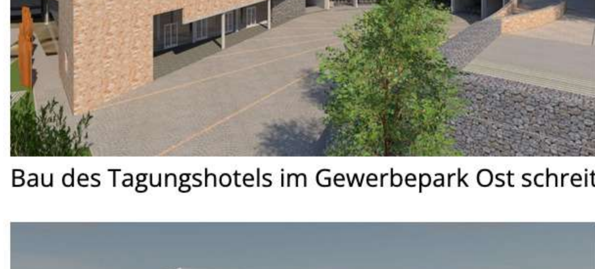
Bau des Tagungshotels im Gewerbepark Ost schreitet voran