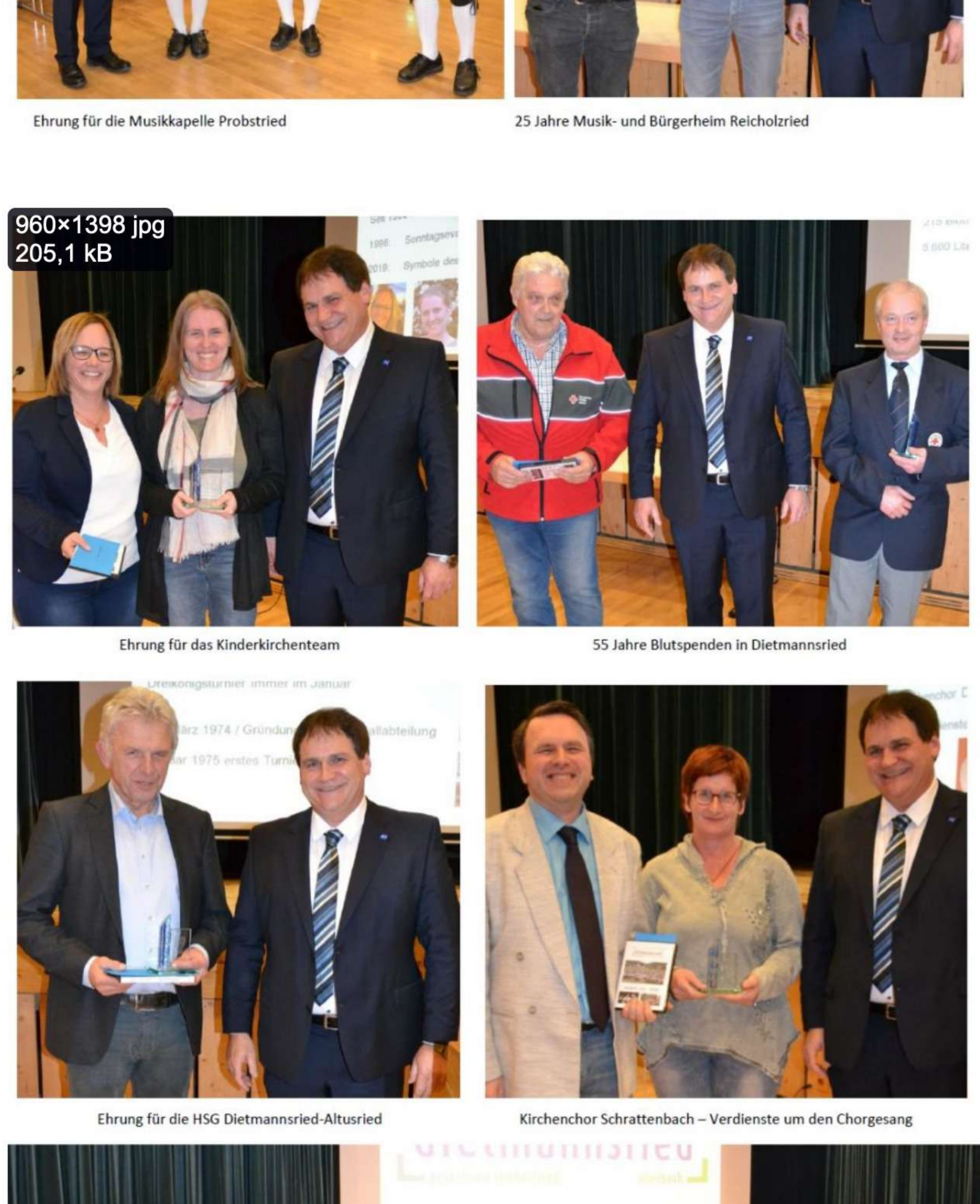
Ehre wem Ehre gebührt – Neujahrsempfang 2020