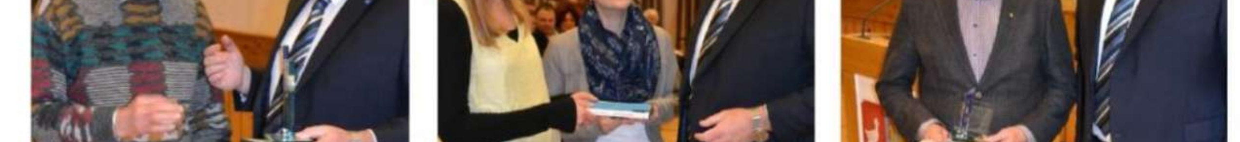
Ehrung für die HSG Dietmannsried-Altusried Kirchenchor Schratzenbach – Verdienste um den Chorgesang