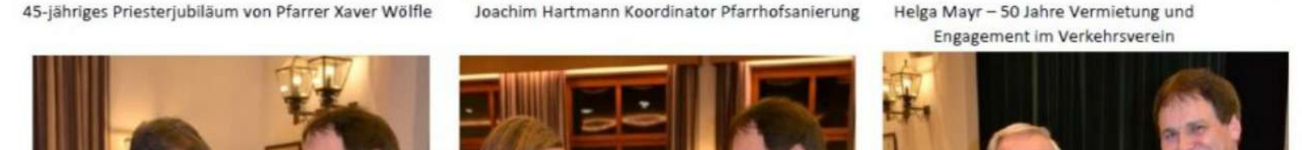
Ehrung für die Musikkapelle Probstried 25 Jahre Musik- und Bürgerheim Reicholzried