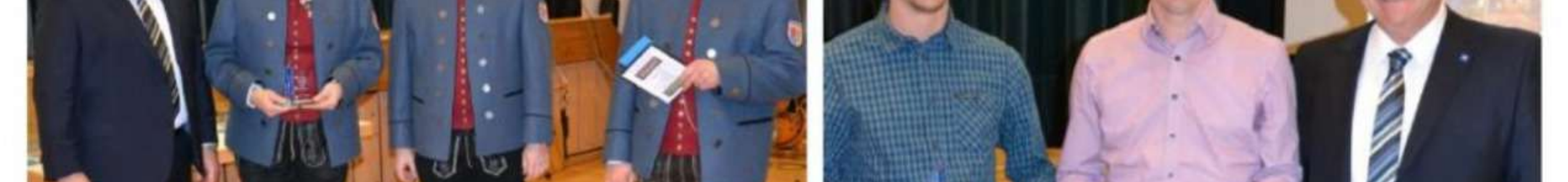
Ehrung für die HSG Dietmannsried-Altusried Kirchenchor Schratzenbach – Verdienste um den Chorgesang