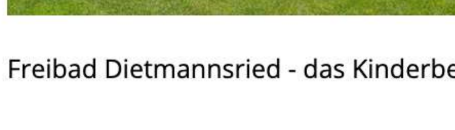
Freibad Dietmannsried - guter Start in die Saison

Allen Badegästen viel Freude in unserem Freibad.