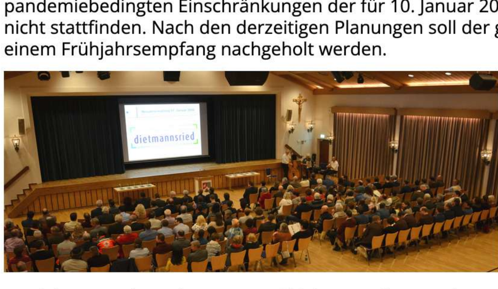
Neujahrsempfang abgesagt - Frühjahrsempfang geplant

„Zu einem guten Ende gehört auch ein guter Beginn“. Diese Redewendung allein zeigt schon die Wichtigkeit der Neujahrsempfänge mit denen wir mit den Verantwortlichen der Vereine und Organisationen das Jahr beginnen. Leider kann aufgrund der pandemiebedingten Einschränkungen der für 10. Januar 2022 geplante Neujahrsempfang nicht stattfinden. Nach den derzeitigen Planungen soll der gemeinsame Austausch in einem Frühjahrsempfang nachgeholt werden.