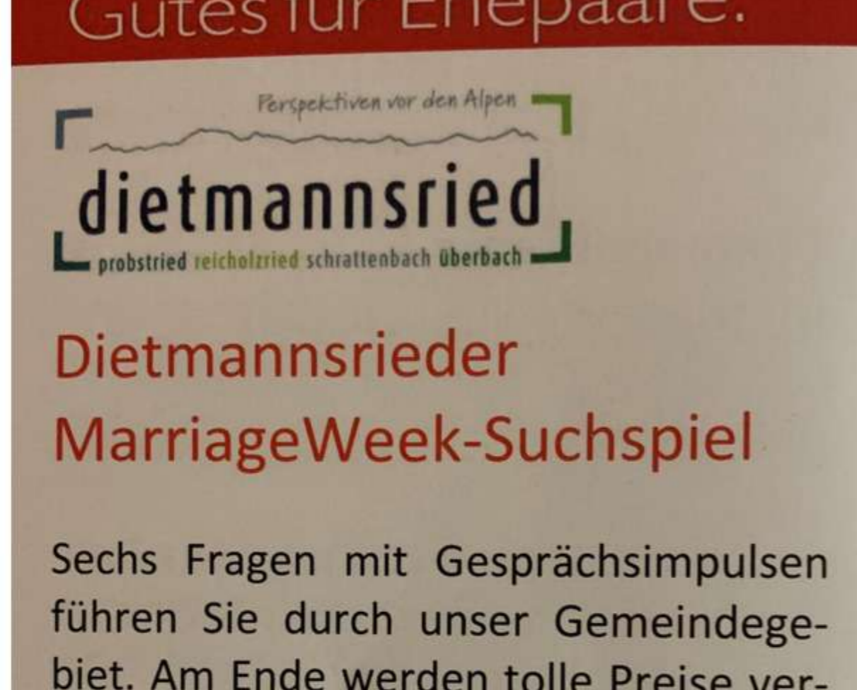
Viele Bürgerinnen und Bürger beteiligten sich beim diesjährigen Suchspiel

Nochmals herzlichen Dank für Ihre Teilnahme und Ihr Interesse an unserem Ort.