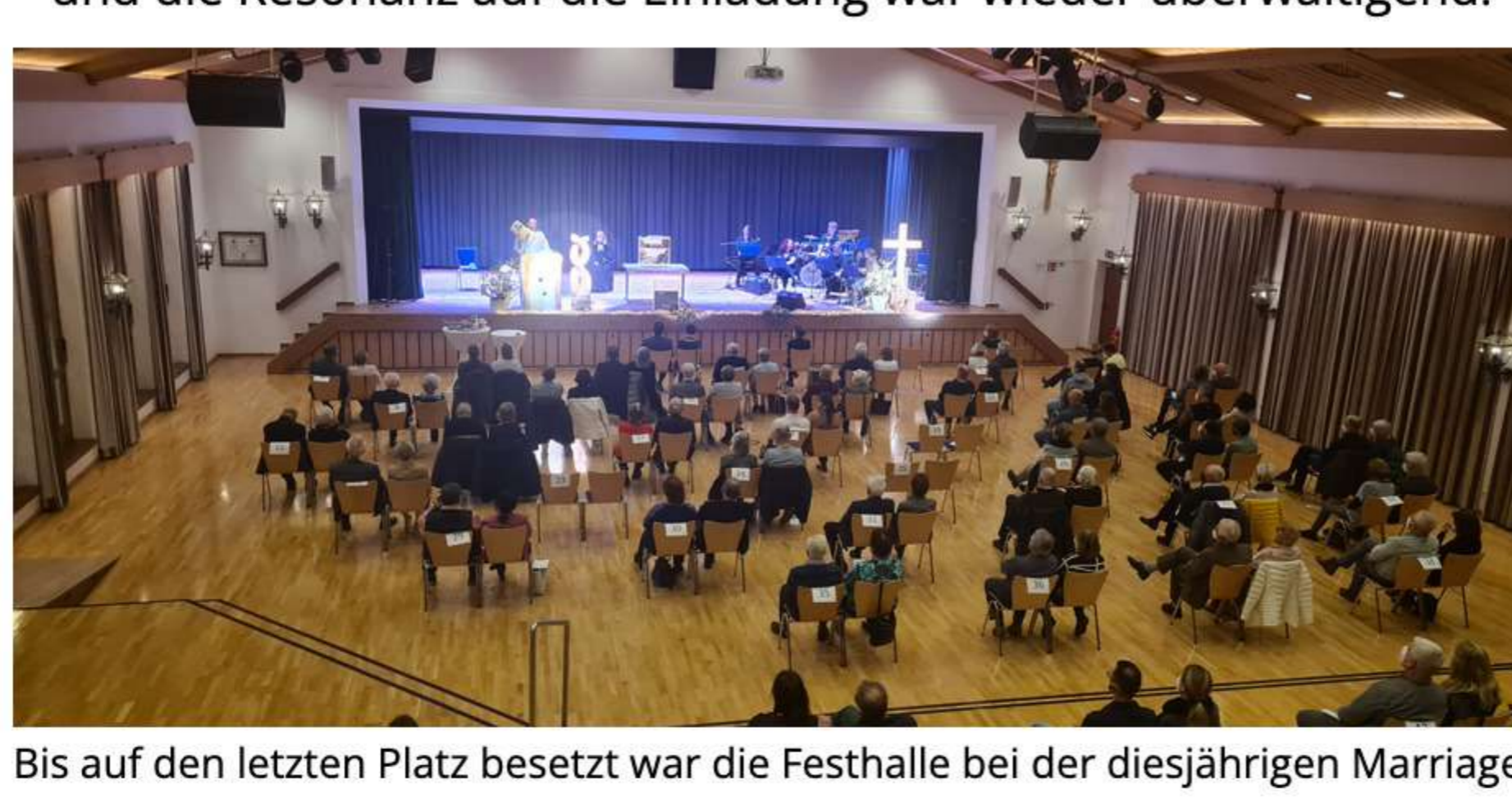
Bis auf den letzten Platz besetzt war die Festhalle bei der diesjährigen Marriage-Week

Wo sonst die Proben für die bekannten Narrensitzungen unserer Faschingsgesellschaft Dietmannsried ein fester Bestandteil des Kalenders der Festhalle Dietmannsried sind, fand in diesem Jahr am Valentinstag der ökumenische Gottesdienst zur MarriageWeek statt. Schon seit vielen Jahren gibt es die MarriageWeek, die sogenannte Woche der Ehepaare. Premiere feierte die MarriageWeek im Jahre 2018 in Dietmannsried. In dieser Woche rund um den Valentinstag gibt es eine ganze Reihe von Vorträgen und Veranstaltungen hinsichtlich dem Erleben der Ehe, Partnerschaft und Zweisamkeit. Trotz aller Einschränkungen lud auch in diesem Jahr die Marktgemeinde, unter Beachtung der Hygiene- und Abstandsvorgaben der Corona-Pandemie, in die Festhalle Dietmannsried ein – und die Resonanz auf die Einladung war wieder überwältigend.