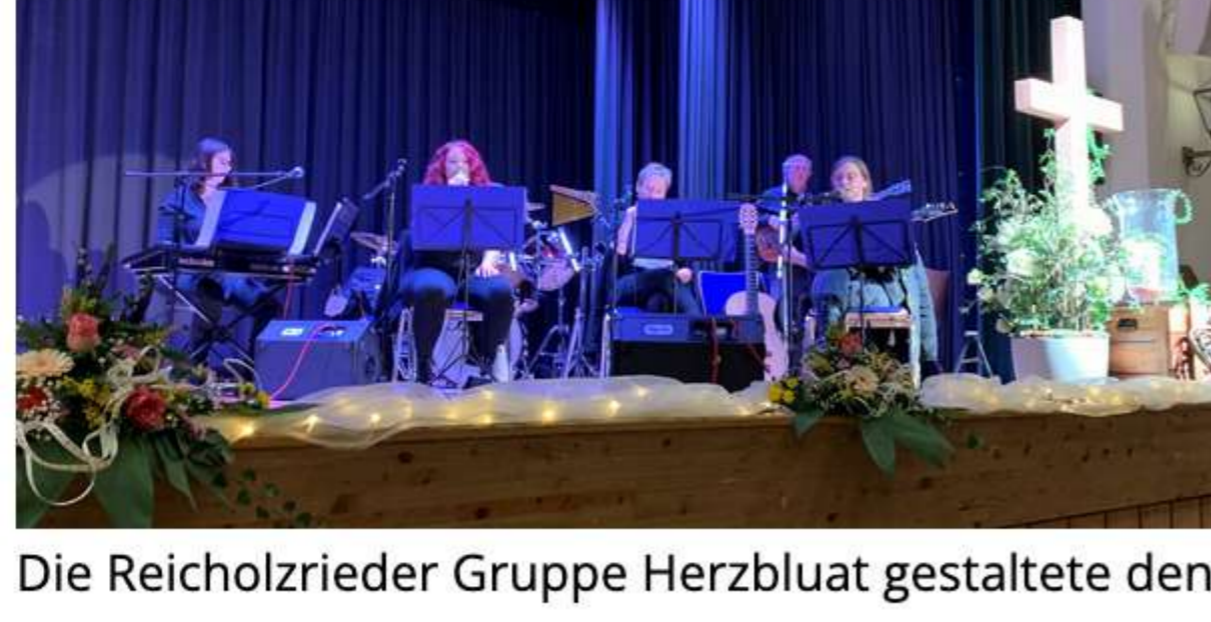
Die Reicholzrieder Gruppe Herzbluat gestaltete den Gottesdienst in diesem Jahr.