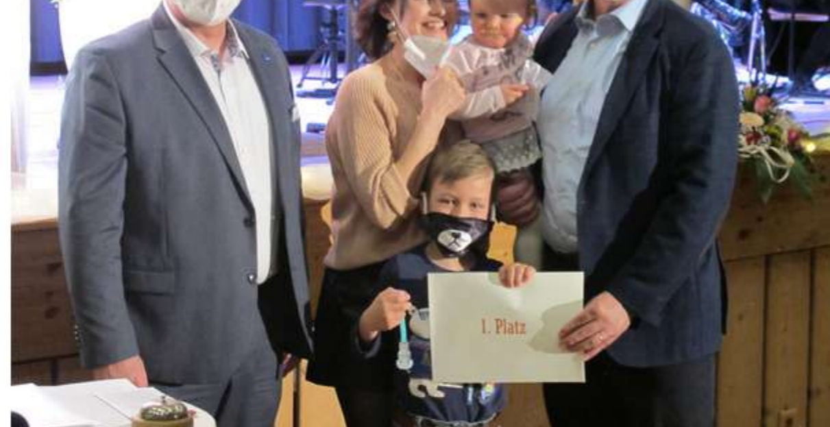
Strahlende Sieger beim diesjährigen Suchspiel

Allen Verantwortlichen, Ideengebern und Mithelfern der diesjährigen MarriageWeek sagen wir nochmals ein herzliches Vergelt's Gott. Gerade in dieser Zeit war es eine sehr wichtige Gemeinschaftsveranstaltung in unserer Gemeinde.