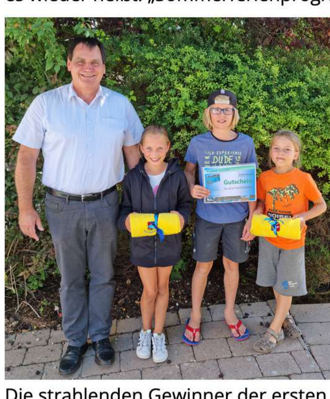
Die strahlenden Gewinner der ersten Rundfahrt

Leider neigen sich die Sommerferien 2022 schon wieder dem Ende zu. In einem sehr großen und umfangreichen Ferienprogramm gab es für unsere Kinder und Jugendliche viele tolle Angebote. Auch die „Rundfahrt mit dem Bürgermeister“ wurde gut angenommen und so konnten die Kinder und Jugendlichen viel über die Gemeinde erfahren (wir berichteten). Zum Abschluss der Rundfahrten gab es ein sehr interessantes Quiz, das von allen mit „Bravur“ gemeistert wurde. So war also auch nicht verwunderlich, dass die „Stockerplätze“ verlost werden mussten. Herzlichen Dank nochmals an alle Teilnehmerinnen und Teilnehmer für das Interesse an unserer Gemeinde. Und am Ende der Ferien ist ja meistens auch schon wieder vor den Ferien und wir freuen uns alle wenn es wieder heißt: „Sommerferienprogramm 2023“.