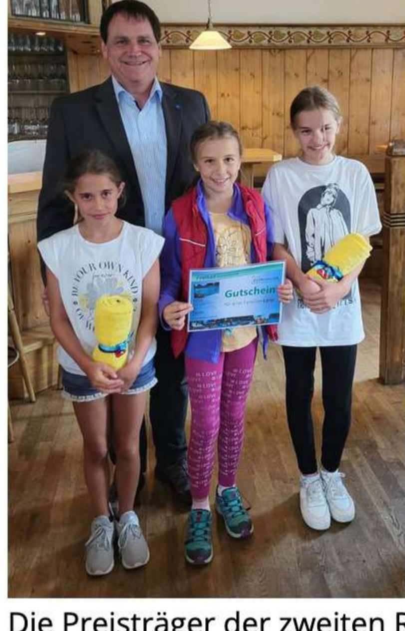
Die Preisträger der zweiten Rundfahrt