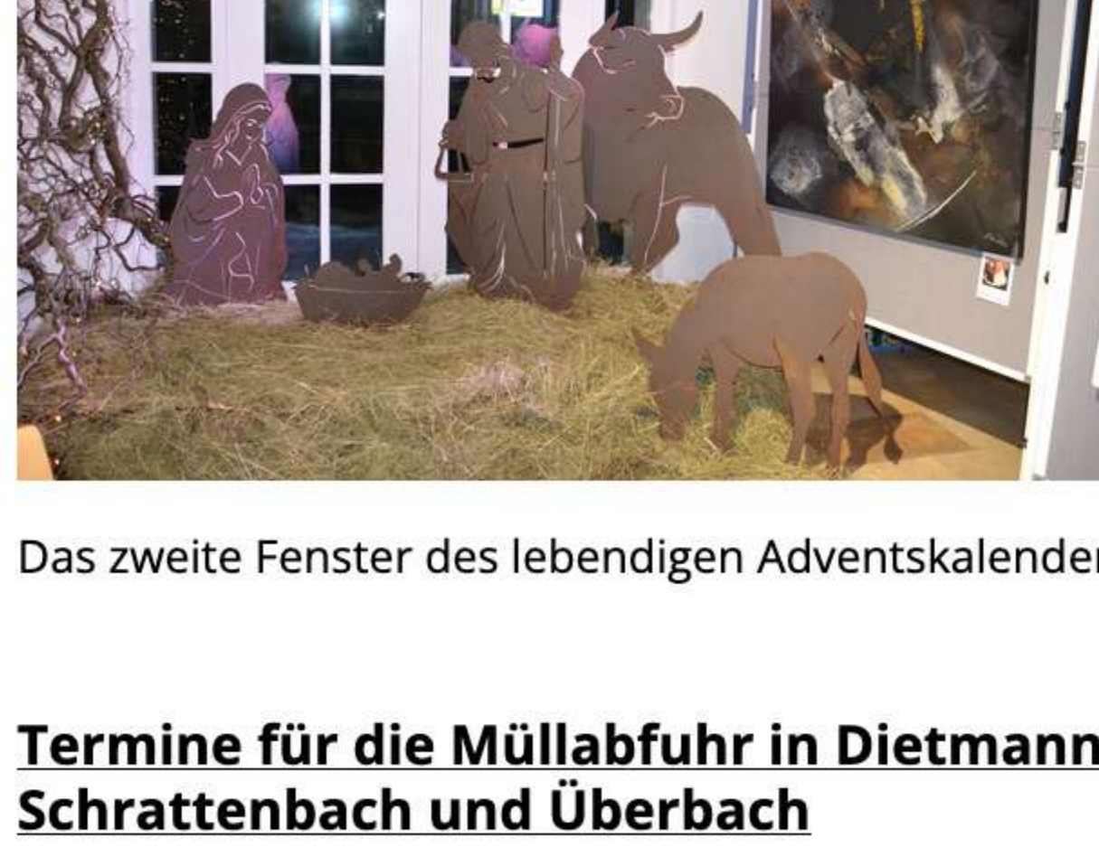
Das zweite Fenster des lebendigen Adventskalenders wurde im Rathaus eröffnet.