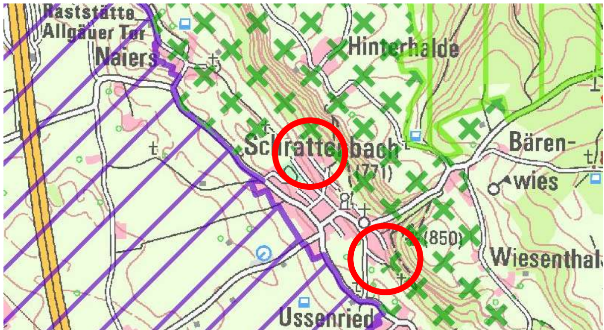
Abbildung 1: Regionalplan-Darstellungen im Umfeld des Plangebiets

In Kap.B2, Begründung zur Bestimmung der landschaftlichen Vorbehaltsgebiete, steht zur Hangzone zwischen Schrattenbach und Börwang: „Der herausgehobene steile Osthang des ehemaligen Iller-Urstromtales setzt sich in der Region Donau-Iller fort. Die Illerleite stellt insbesondere bei Schrattenbach eine wichtige süd-west-exponierte Biotopstruktur am Rande der sonst biotoparmen und durch großflächigen Kiesabbau beeinträchtigten Iller-Hochterrasse dar. Künftig bedarf es der stärkeren Berücksichtigung naturnaher Waldbaumaßnahmen. Im Hinblick auf die Erholungsnutzung wäre auch eine Freistellung markanter Aussichtspunkte erstrebenswert.“