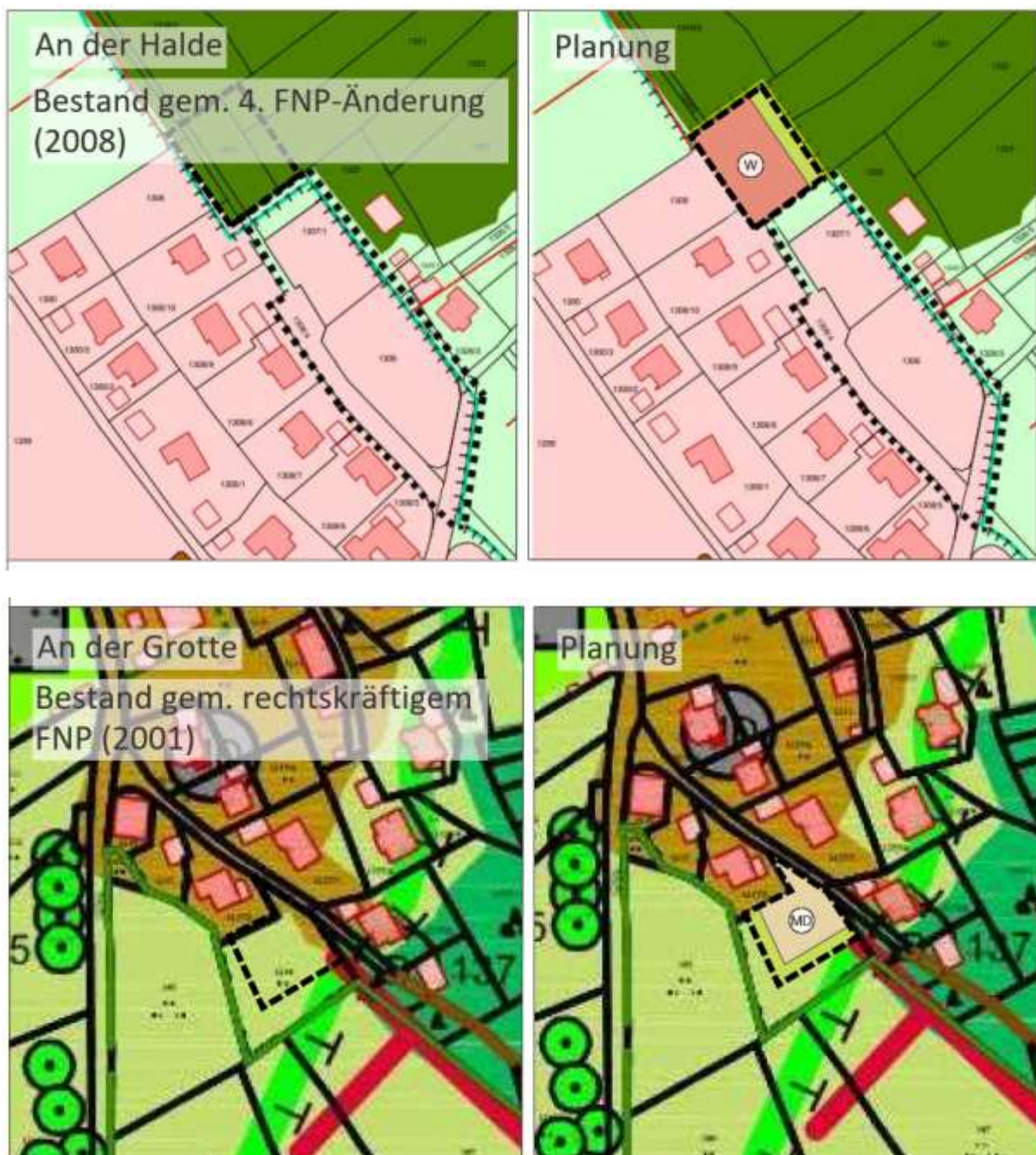
Abbildung 3: Gegenüberstellung von Bestand und Planung im FNP, oben Teilfläche 1, unten Teilfläche 2, unmaßstäblich

Im derzeit rechtsgültigen Flächennutzungsplan der Marktgemeinde Dietmannsried ist der überplante Änderungsbereich der Teilfläche 1 als Wald, der Teilfläche 2 als landwirtschaftliche Nutzfläche dargestellt. Lediglich ein schmaler Streifen im Norden der Teilfläche 2 stellt bereits ein Mischgebiet dar. Darüber hinaus lassen sich den Darstellungen auch ortsbildprägende Hänge, bestehende Wohn- und Mischbauflächen und Grünstrukturen entnehmen.