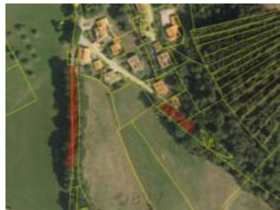
Abbildung 5: Zwei amtlich kartierte Biotope im Umfeld der Teilfläche 2