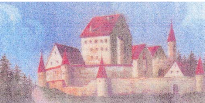
Schloss Falken um 1745